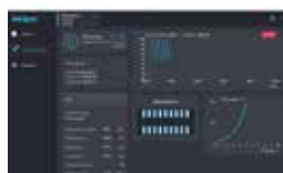
Aplikácia sa používa